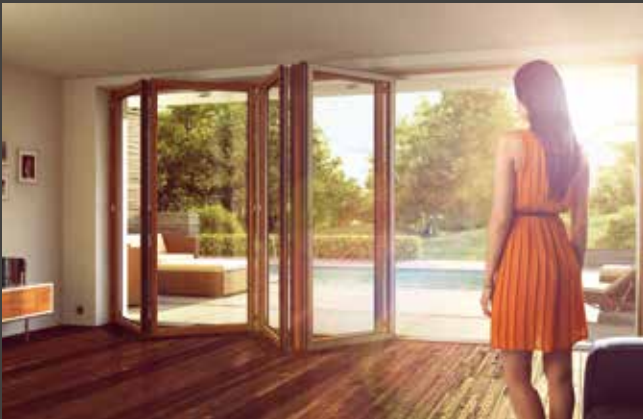
Sistemas corredizos plegables Sistemas de correr de harmónio