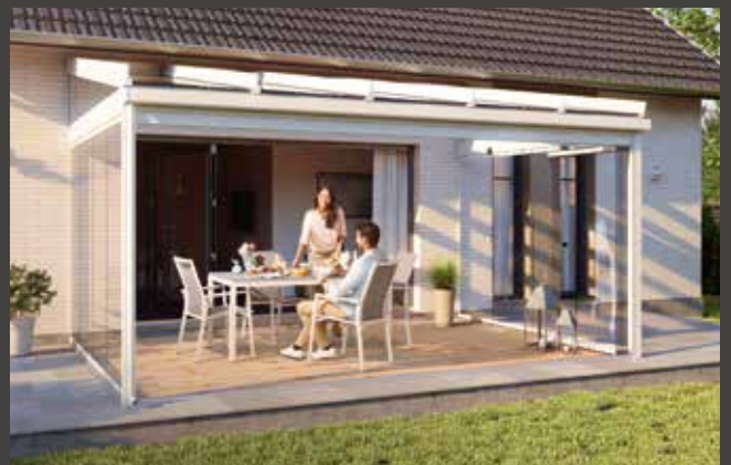
Con el techo de terraza Com a cobertura de terraço