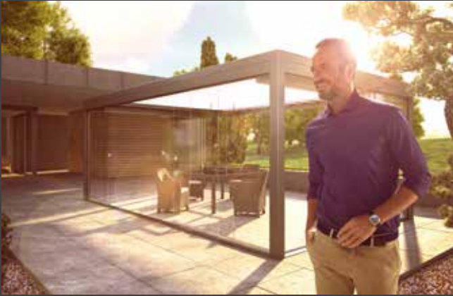
Sistemas corredizos Sistemas de correr