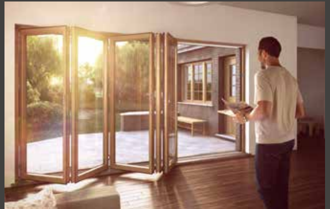
Pared plegable de madera Porta de fole em madeira