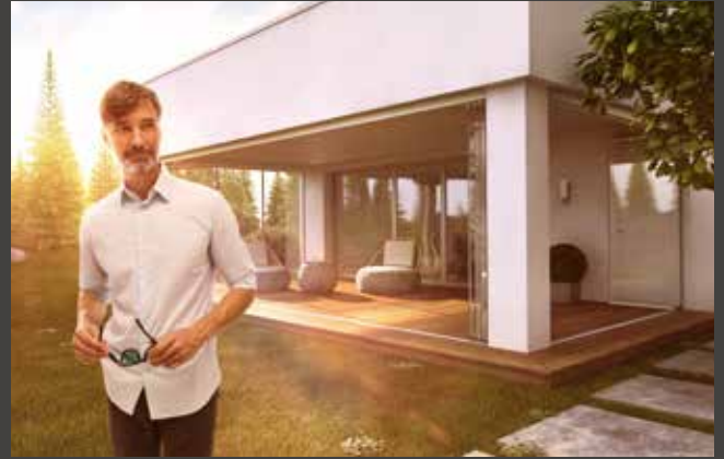
Sistemas corredizos giratorios Sistemas de correr e giratórios